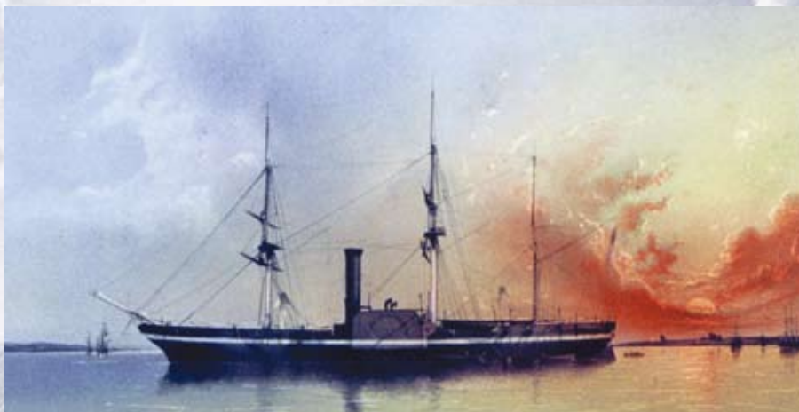
万延元年の遣米使節団を乗せて太平洋を横断したポーハタン号