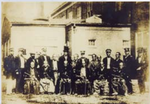
ワシントン造船所で記念撮影

すると、この5年後に横須賀製鉄所（明治4年造船所と改称）が起工されたのは、遣米使節段階からの既定路線だったのです。但し、それがアメリカの技術と指導を仰がなかったのは、周知のように1861～65年まで南北戦争