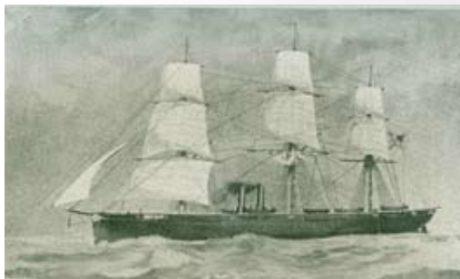
帰国船ナイアガラ号

11月8日三浦半島松輪村沖の海上に碇泊、翌日横浜港で従者等を下船させ、品川沖に碇泊。