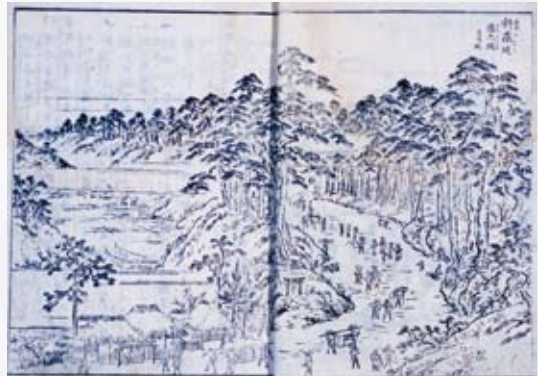
「江戸名所図会」所収品濃村

その後加増されて、1625年（寛永2年）には811石5斗を知行しました。正勝は品濃村に陣屋を構えていました。現在の しらばた 白旗神社境内（戸塚区品濃町518番地 - 7）が跡地といわれ、数百年の間、地元の方々が手厚く守ってきました。また、同所谷宿公園近くには正勝の墓も現存します。1643年