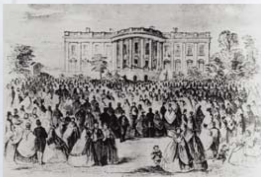
ホワイトハウスでの園遊会

① 多様な視察先 遣米使節団は旅行途中でもさまざまな体験をしました。それは個人にとっても、幕府や日本という国にとっても貴重な経験でした。ここでは、アメリカでの視察先を見ておきましょう。